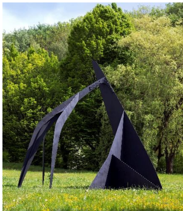
Calder, Guillotine pour huit , 1963 LAM Lille,

Certains artistes ont fait comme toi, des sculptures avec des surfaces et des plans imbriqués, Calder par exemple aimait beaucoup jouer sur l'équilibre et le déséquilibre. Il a créé des sculptures appelées des stables par opposition à ses mobiles qui étaient des sculptures mouvantes. Voici un lien pour prendre des informations sur l'artiste : https://fr.wikipedia.org/wiki/Alexander_Calder Regarde cette œuvre, ne te fait-elle pas penser à ta propre création ? Peut-être as-tu déjà vu cette sculpture de Calder à l'entrée du parc du musée du LAM ?