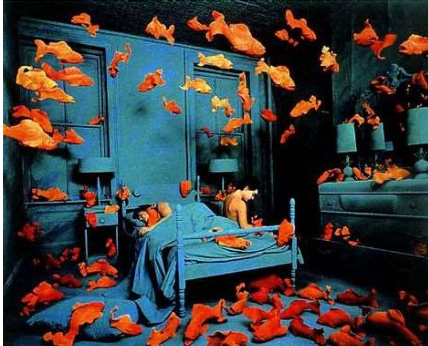
La revanche du poisson rouge, 1981

Voici une artiste, Sandy Skoglund, qui réalise des décors étonnants avant de les photographier. Les poissons sont réalisés en terre cuite.