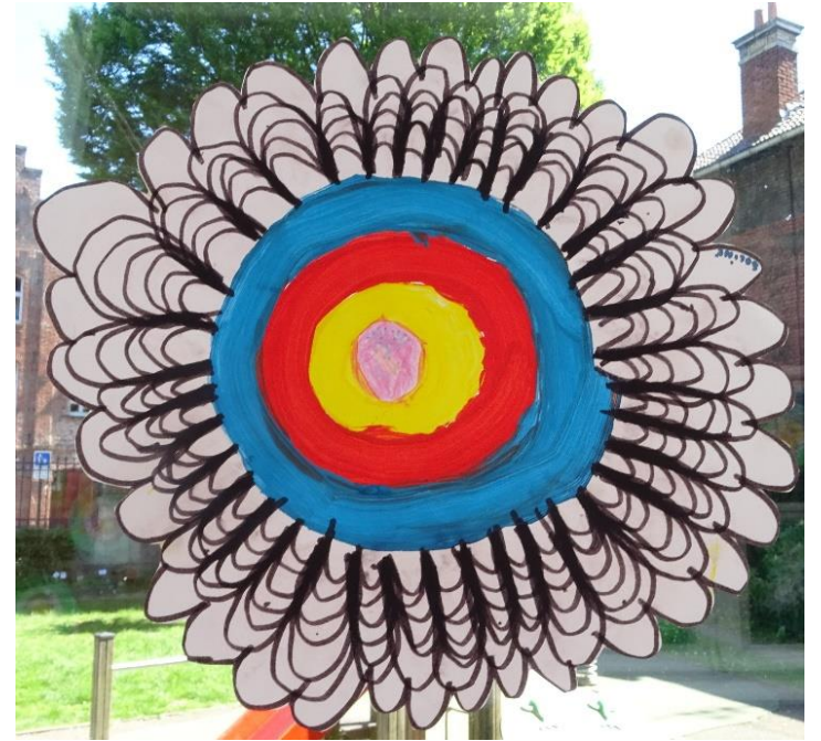
Voici quelques productions d'élèves réalisées de la même façon