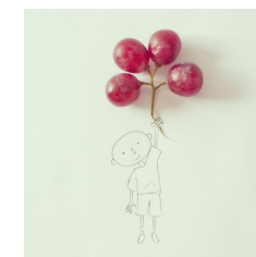
la grappe de raisin permettra peut-être à cet enfant de voler !

Etape 3 : Réalise ton dessin et gardes en trace en le prenant en photo Et bien sûr fais en autant que tu veux