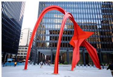
Flamingo 1973 Chicago USA (Stabile)

Calder est surtout connu pour ses mobiles et ses stables.