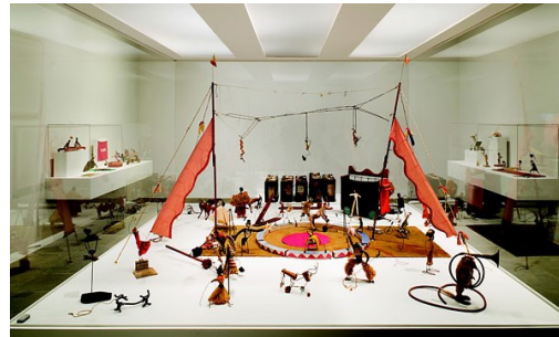
Cirque Calder, 1926-1931

Tu as pu remarquer que Calder ne manquait pas d'imagination, n'importe quel objet pouvait être utilisé, détourné !