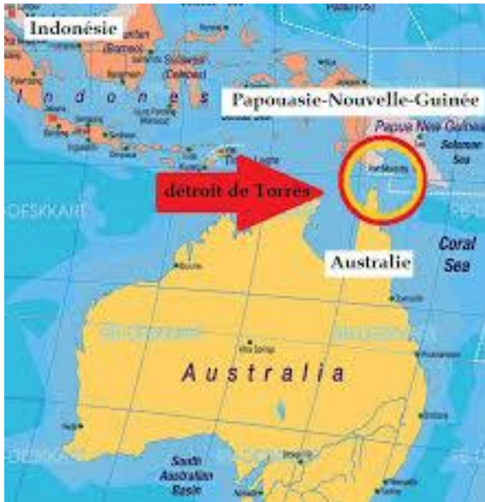
Le détroit de Torrès