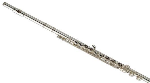
LA FLûTE TRAVERSIERE