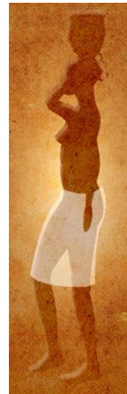
LA JEUNE FILLE

La flûte traversière est un instrument à vent de la famille des bois car elle a été très longtemps fabriquée en bois. Elle doit son nom à la position avec laquelle on l'a tient : de côté horizontalement. On souffle dans l'embouchure pour produire le son. Elle a un registre aigu, comme celui de la voix de femme.