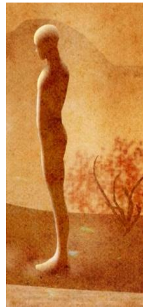
LE JEUNE HOMME

Le violoncelle appartient à la famille des instruments à cordes et à archets. Le son est produit par le frottement d'un archet sur les cordes. Mais l'instrumentiste peut également jouer sans l'archet, en pinçant les cordes. ( pizzicati)