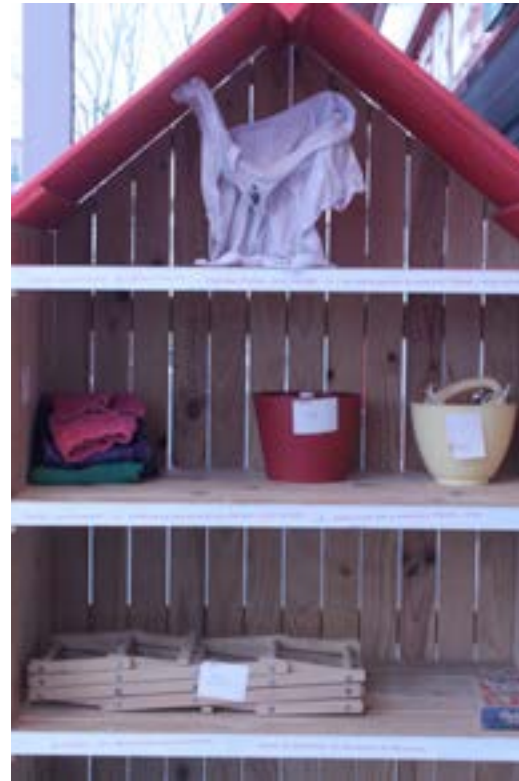
Exposition collective, 2014 Intermarché de Noisseau; France.