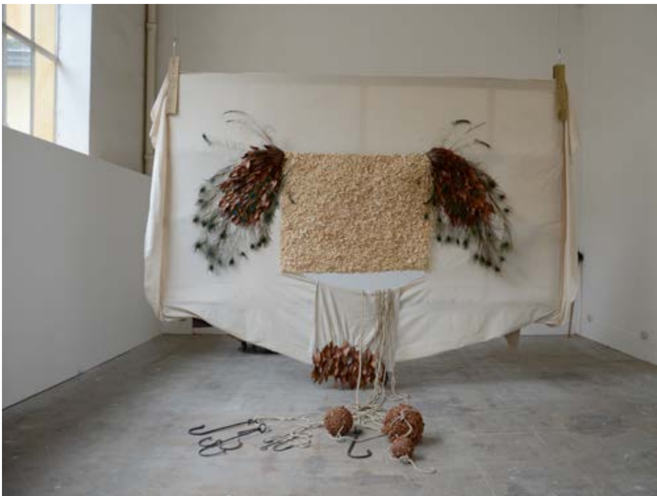
Tapissierie, 2012 - 2014 Installation variable. (sol ou mur suivant l'es- pace) dimensions 4m x 5m