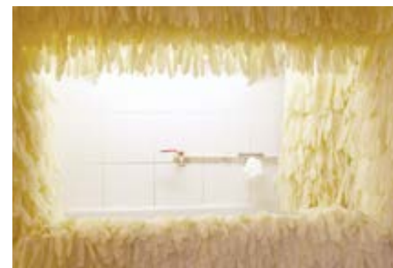
Le boudoir des pleurs, 2012 Installation constituée de gants en latex blancs et de néons. Le visiteur est invité à laver ses mains avec une reproduc- tion de mes mains en savon.