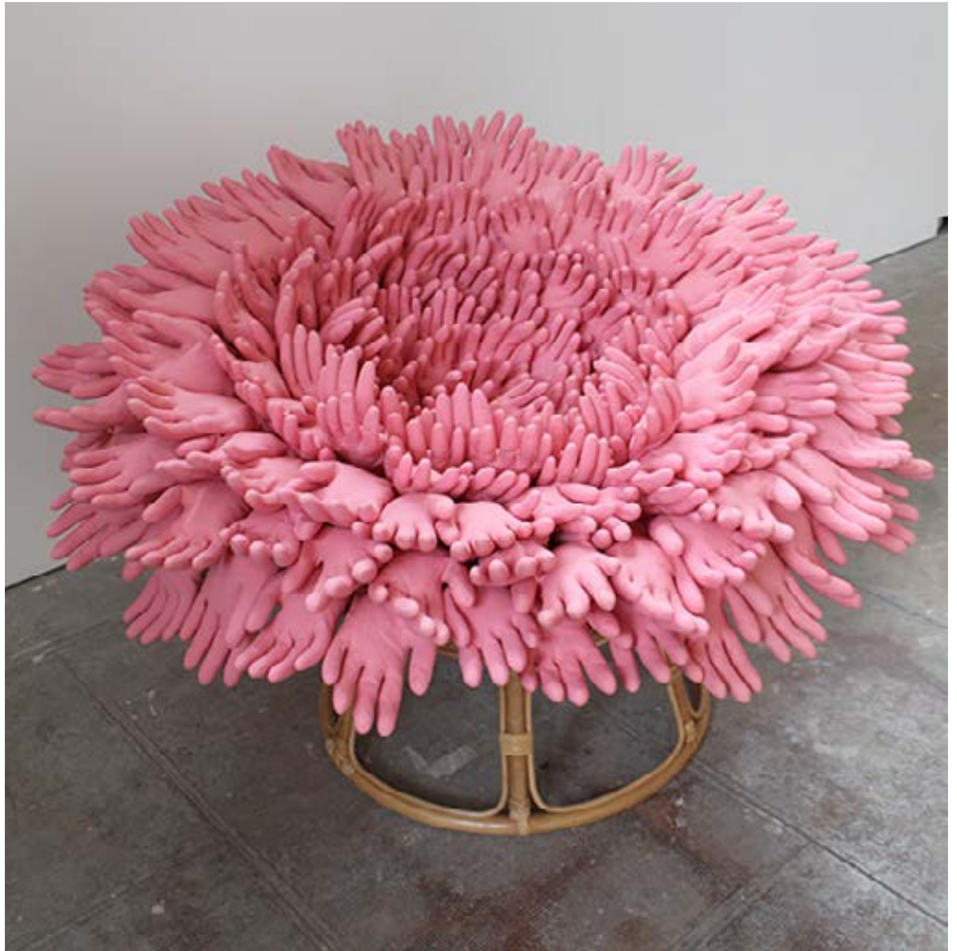
Loveuse, 2011 Installation, Technique mixtes. Diam. 1m10.