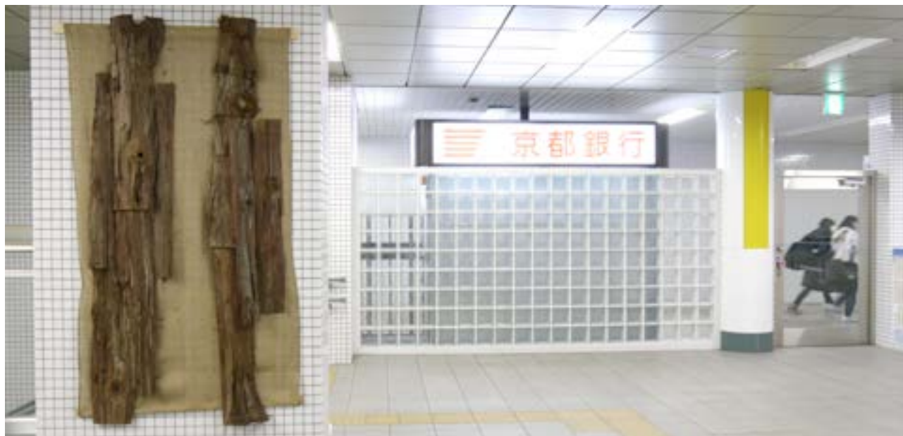
Festival Parasofia, Japon Exposition dans le métro de kyoto, 2015

Ecorce de bois cousu 3 tapisseries, 2 m x 80 cm chaque.