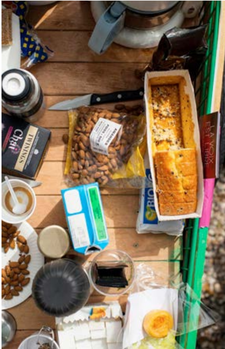
Café mobile, 2014 _ 2015 Paris.

Café, Thé et petits gâteaux disponibles gratuitement à tous, les mercredi matins de 10h à 11h30. Situé en fonction du temps et des envies dans le périmètre autour et dans l'école.