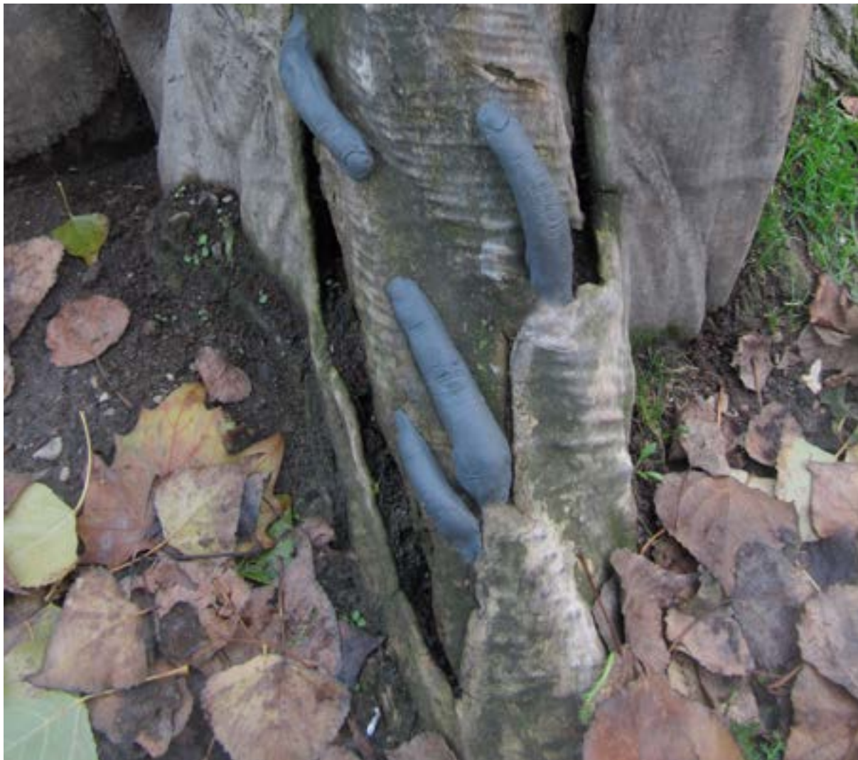
Projet - Les petites résistances - Part 2 Prendre racines, 2011. Photographie de l'installation. 10x15 cm chaque.