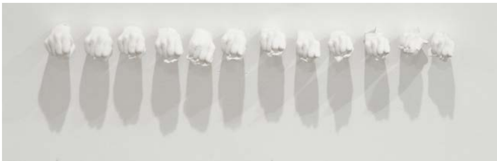
Projet - Les petites résistances - Part 3 Capacité d'épuisement, 2011. Plâtre, dimensions variables.